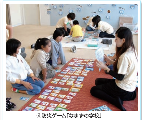
④防災ゲーム「なますの学校」